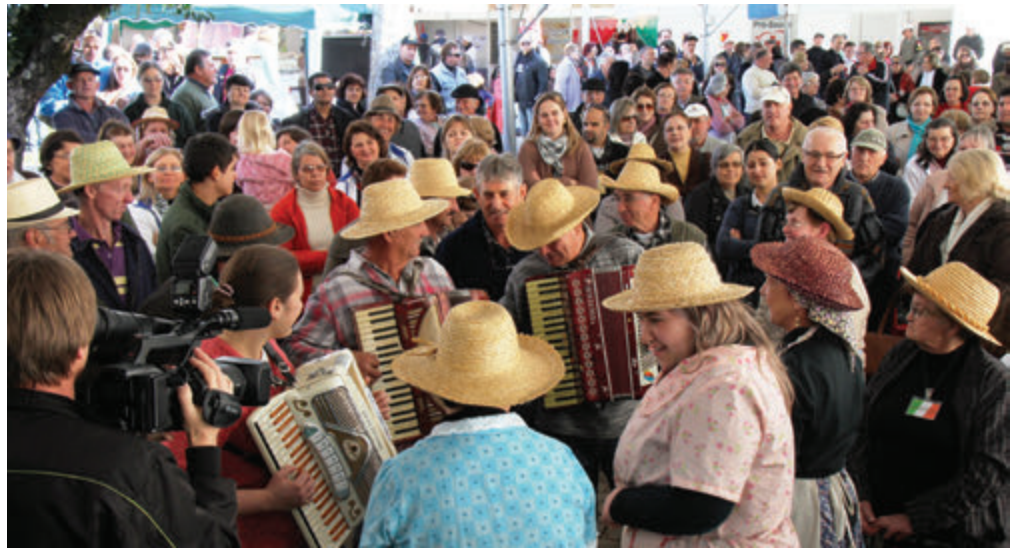
Concertos de Natal

✓ Festival do Moscatel: Evento enogastronômico que visa promover em âmbito nacional o posto ocupado por Farroupilha de maior produtor brasileiro de uvas moscatéis, utilizadas na elaboração de vinhos finos e espumantes.