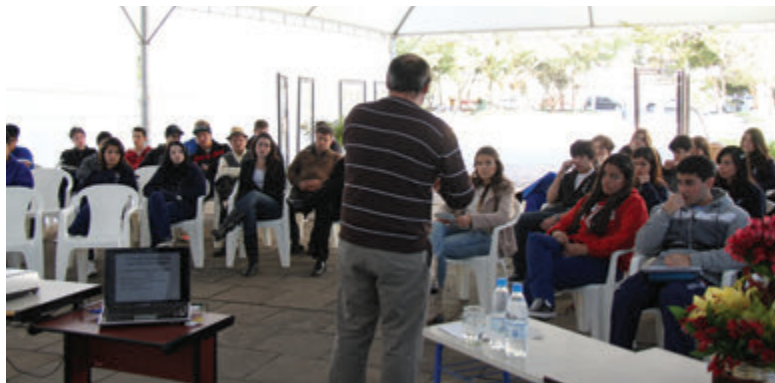
Atividades escolares educativas e exposição fotográfica