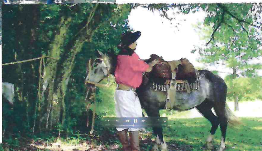
Demonstrações e explicações sobre as encilhas.