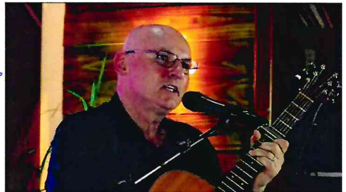
Dia 08/12/2020 – Gravação do Projeto Artístico Cultural – Estúdio Reccanto – Farroupilha-RS