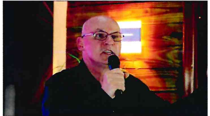
Dia 05/12/2020 – Evangelismo – Bairro Belo Horizonte – Caxias do Sul-RS