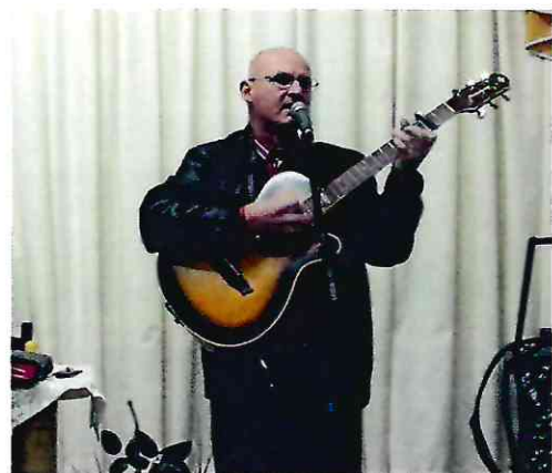
Dia 19/12/2020 – Igreja Ev. Pentecostal Jesus é a Solução – Caxias do Sul-RS