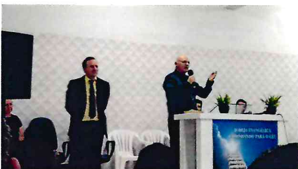
Dia 13/12/2020 – Igreja Evangélica Caminhando Para o Céu – Garibaldi-RS