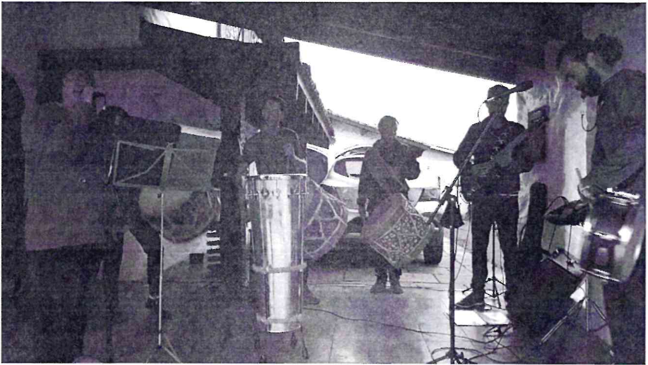
Ensaio 01 para Show Aldir Blanc