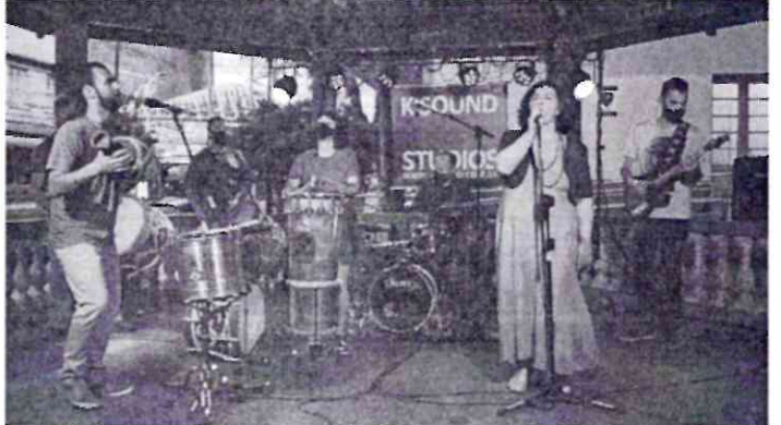
Fotos da execução do projeto, apresentação presencial e gravação.