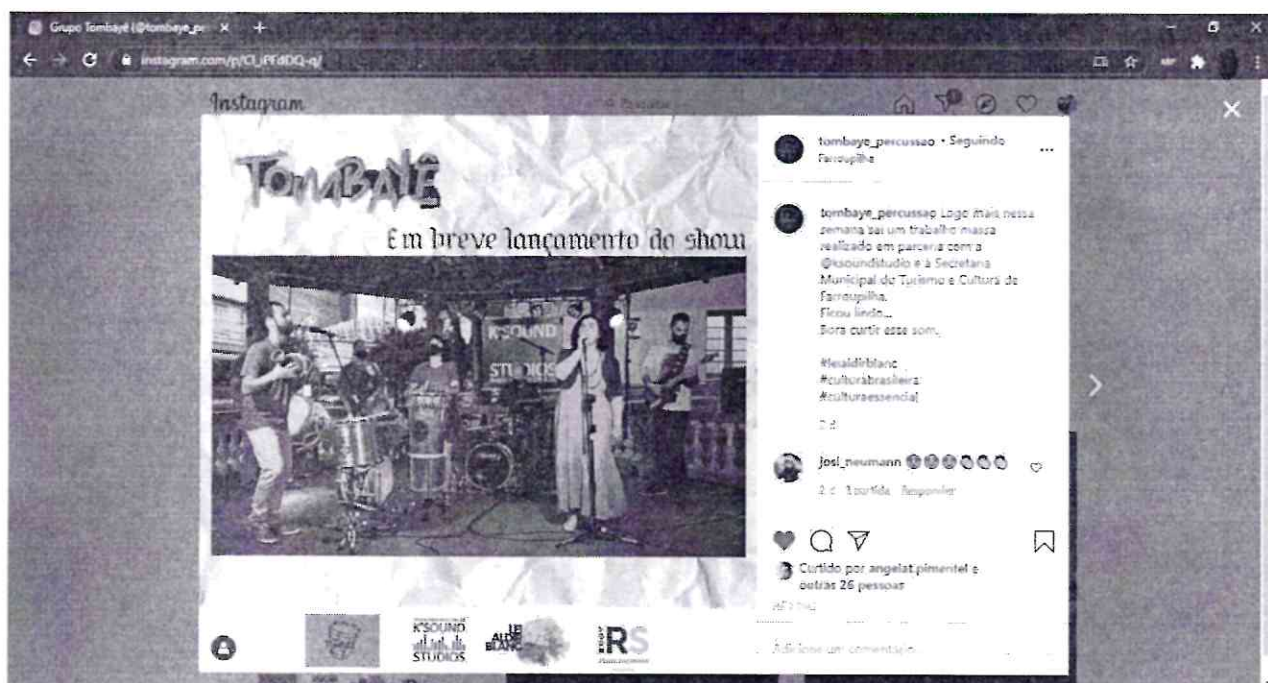
Divulgação digital 2 via Instagram ( https://www.instagram.com/p/CI_iPFdDQ-q/ )