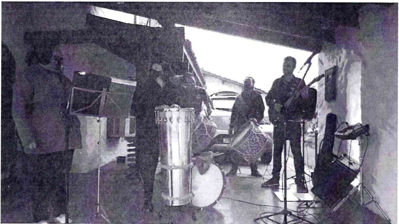
Ensaio 02 para Show Aldir Blanc